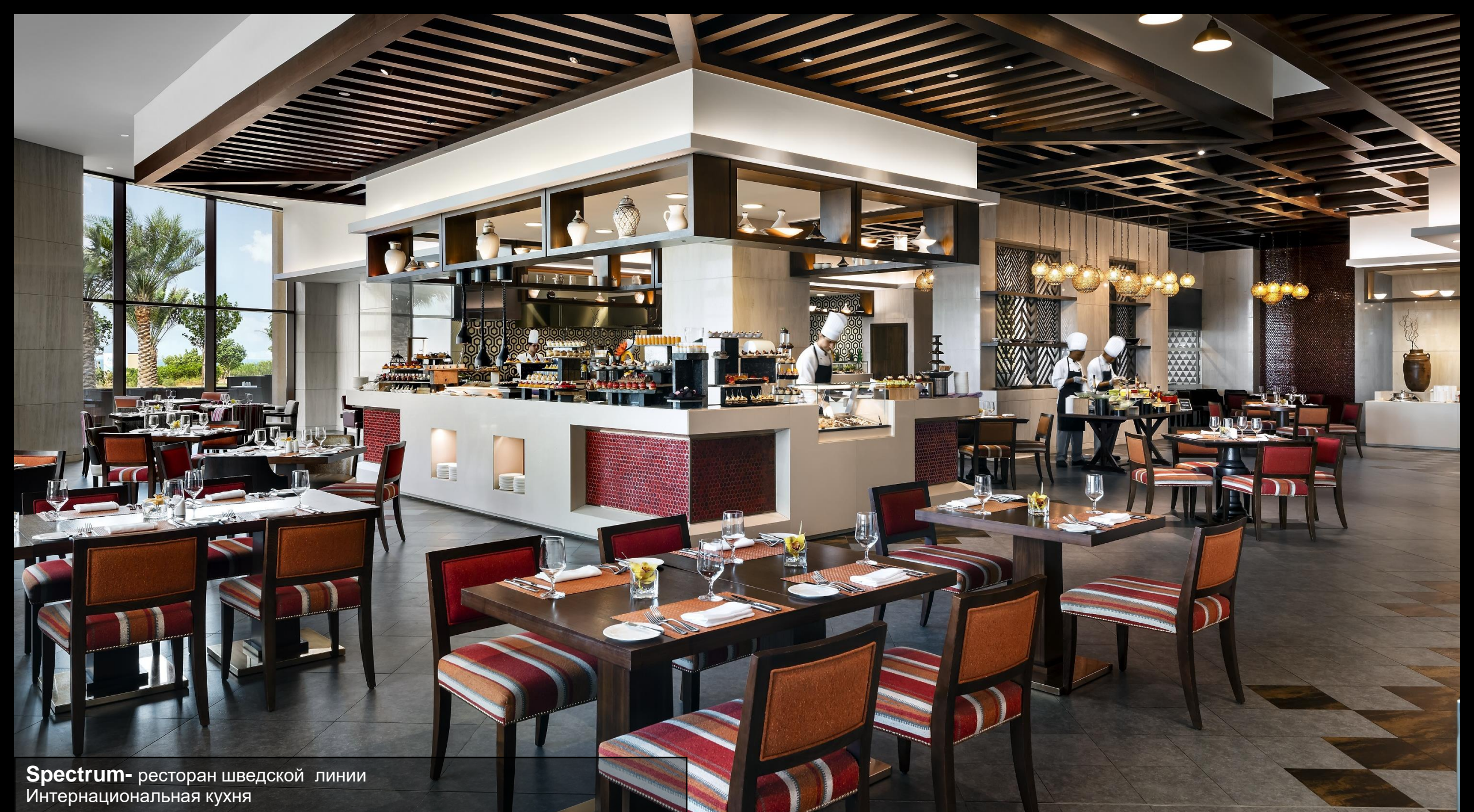
Spectrum - ресторан шведской линии Интернациональная кухня