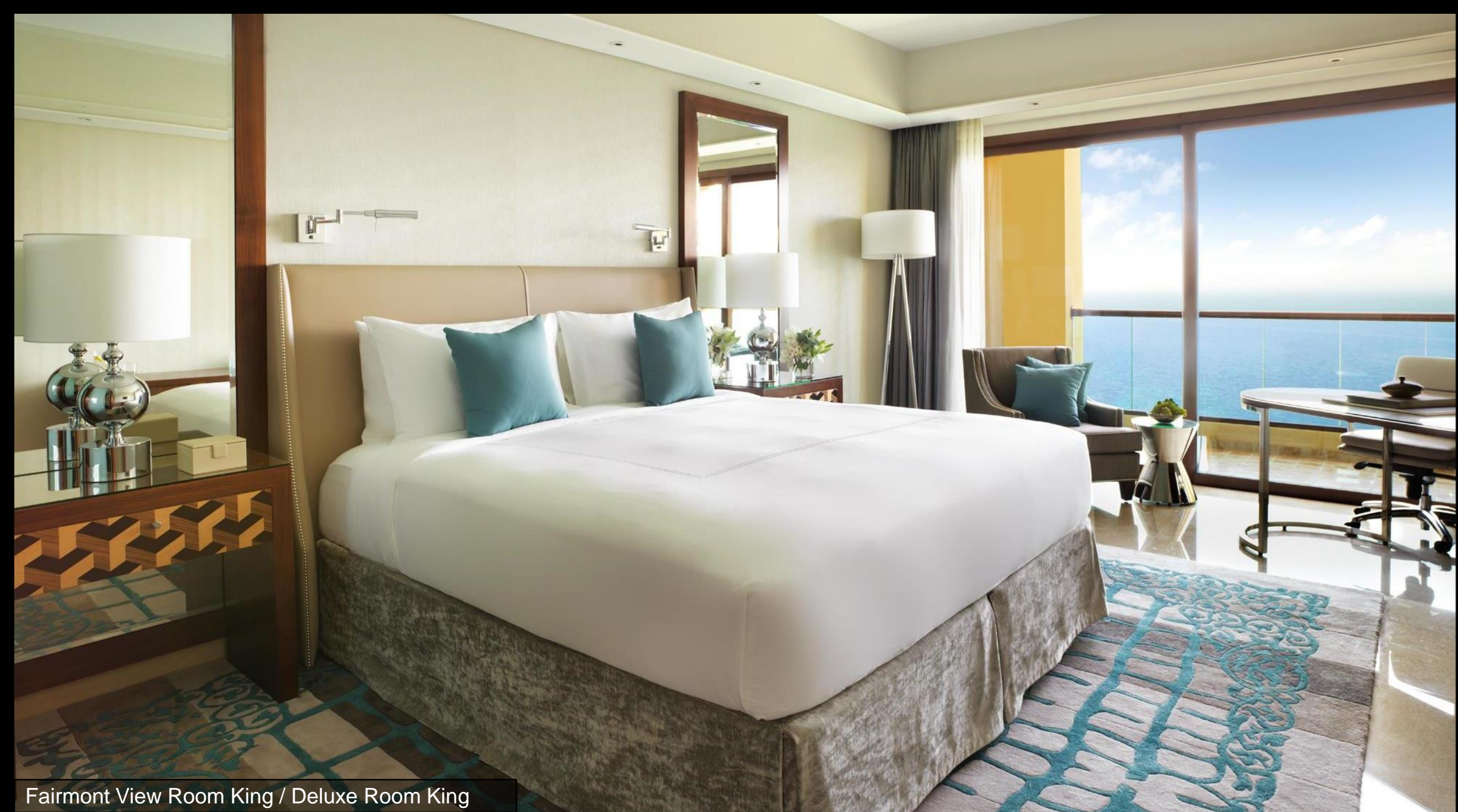
Fairmont View Room King / Deluxe Room King