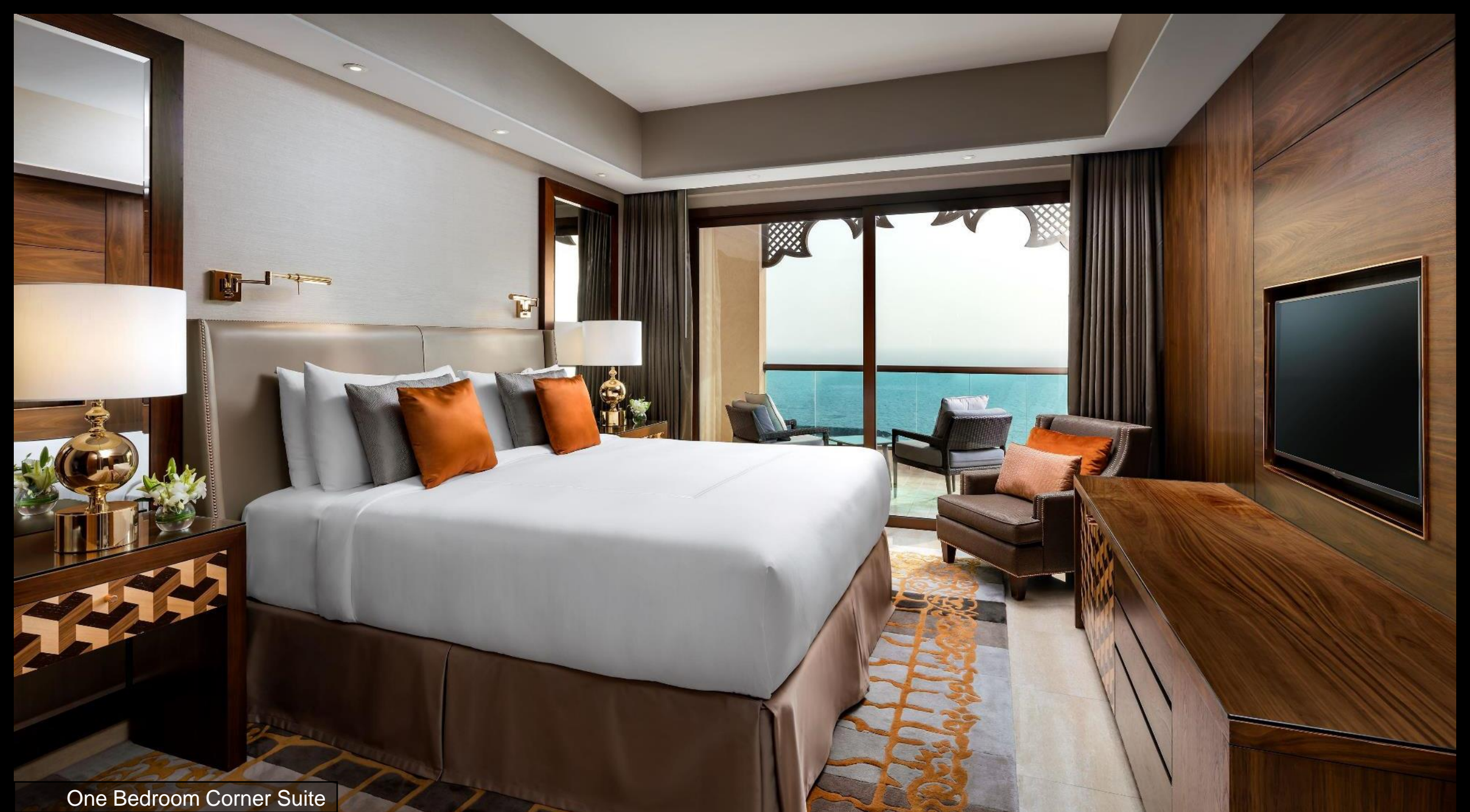
One Bedroom Corner Suite