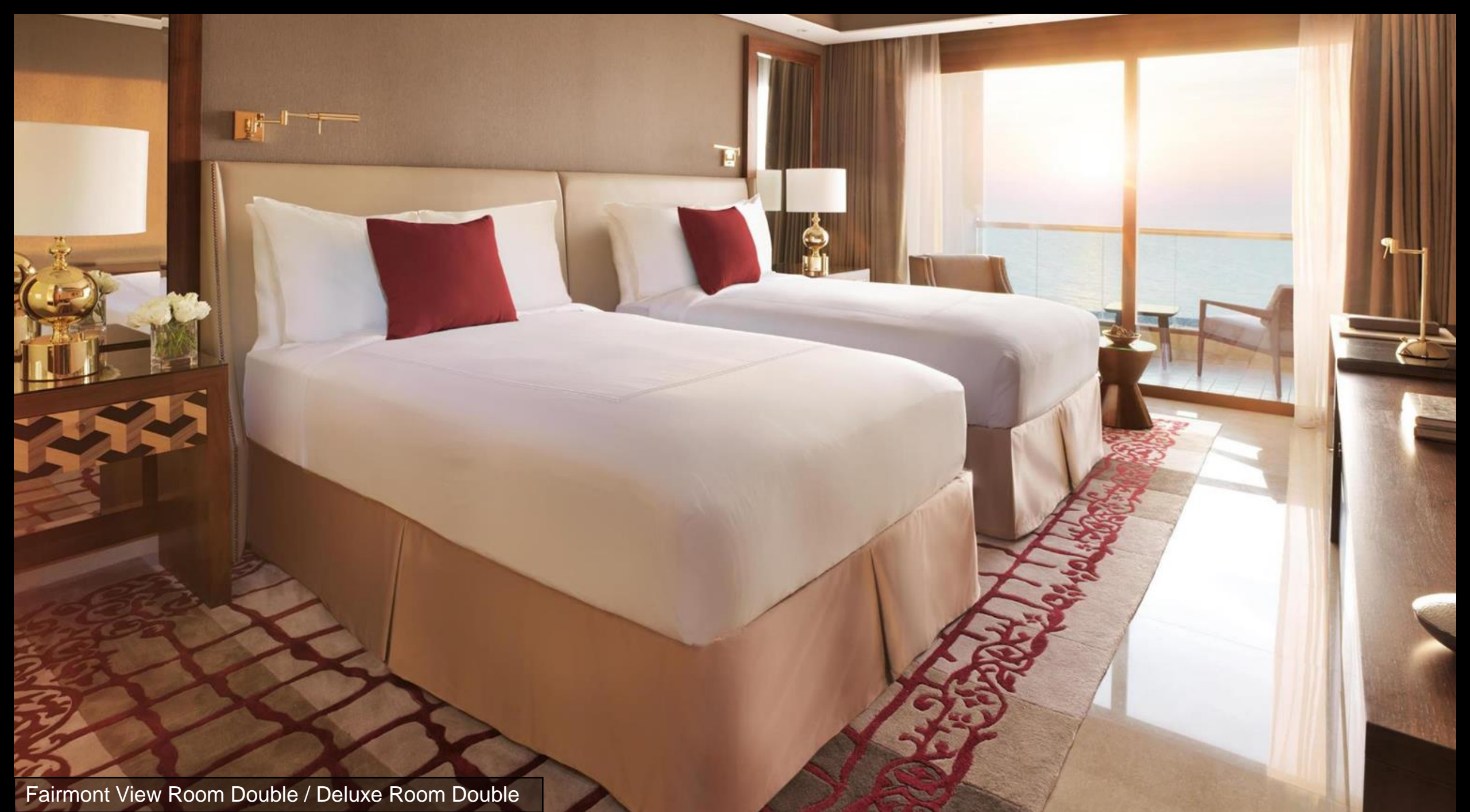
Fairmont View Room Double / Deluxe Room Double